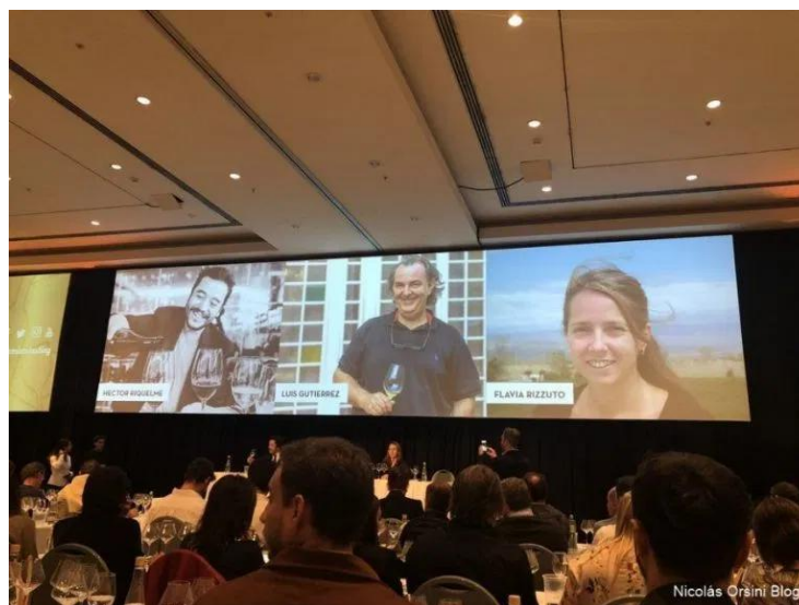
Premium Tasting Mendoza

La última tanda del Premium Tasting Mendoza estuvo dedicada a distintas expresiones de la cepa emblema del país, el Malbec, en distintas zonas de la Argentina.