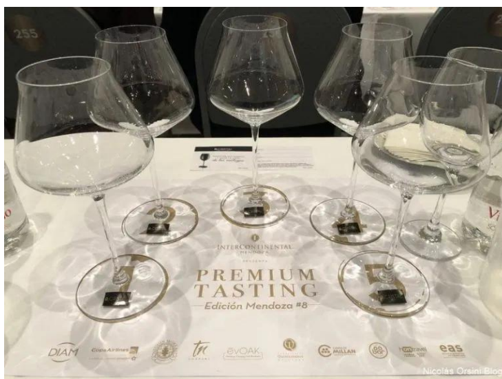
Premium Tasting Mendoza

Todo para que los 543 asistentes disfrutemos del, para mi gusto, eventos más importante del año.