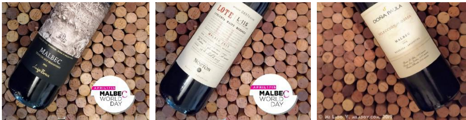
Bodega Luigi Bosca | Familia Arizu, Luigi Bosca Terroir Los Miradores , 2016, AR$ 900.- | Norton, Norton L-115 SV Lunlunta , 2015, AR$ 914.- | Doña Paula, Doña Paula Selección de Bodega , 2014, AR$ 988.-